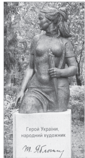
Герой України, народний художник Тетяна Яблонська

Вечір, присвячений 100-річчю від дня народження Героя України, народного художника Тетяни Яблонської відбувся у Седневі. Тепло стало в залі від її імені, від спогадів про неї, від її картин.