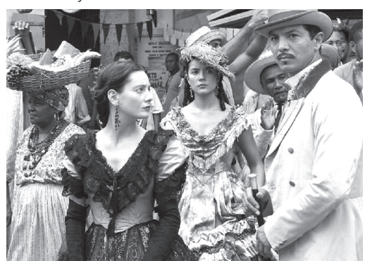
Фільм «Кохання під час холери» за романом Маркеса

У 1982 році Маркесу було присуджено Нобелівську премію з літератури — «за романи і оповідання, в яких фантазія і реалізм поєднані у світі уяви, що віддзеркалює життя і конфлікти цілого континенту».